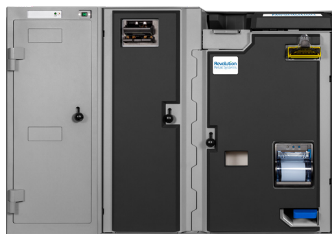
Quantum 4S/6S XL AV