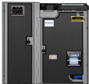
Quantum 4S/6S XL