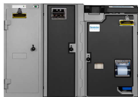
Quantum 4S/6S XL MV