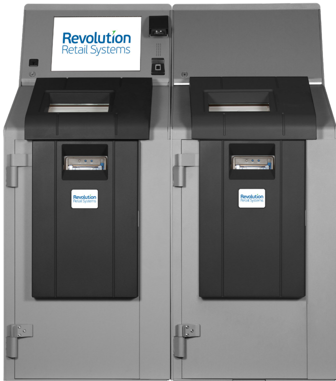
Paragon 4 Billets Dual