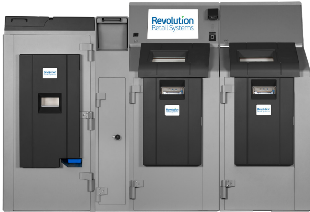
Paragon 3SE/4SE Dual Coffre de Dépôt