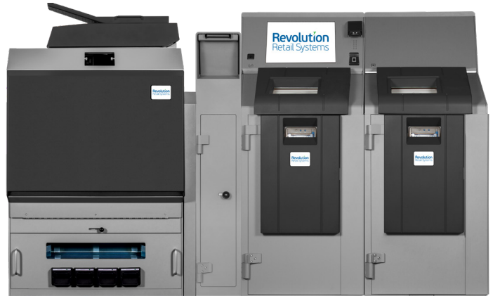
Paragon 3LW/4LW Dual Coffre de Dépôt