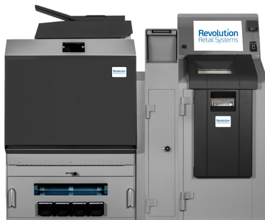
Paragon 3LW/4LW Coffre de Dépôt