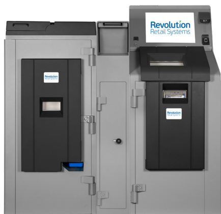
Paragon 3SE/4SE Coffre de Dépôt