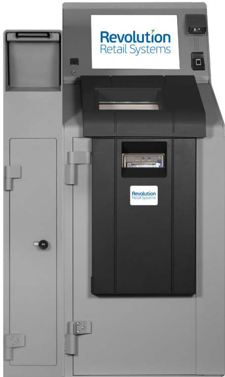
Paragon 3/4 Billets Coffre de Dépôt