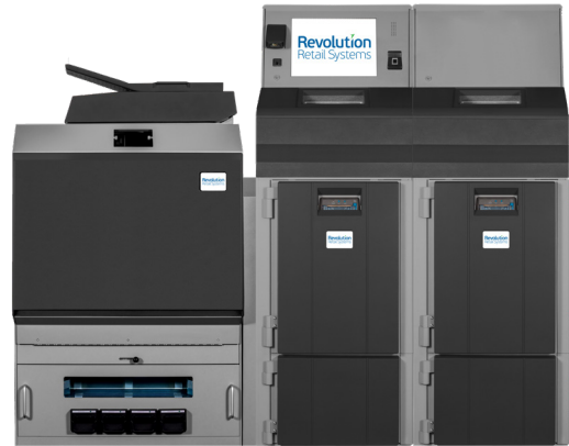
Fortis 4LW/5LW Dual