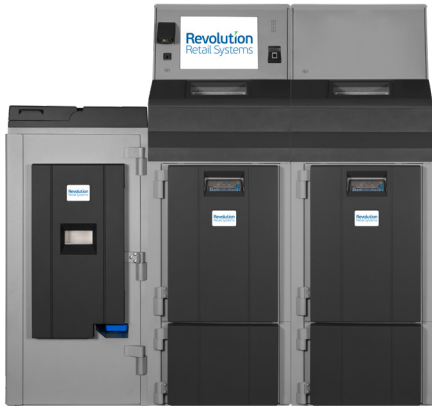
Fortis 4SE/5SE Dual