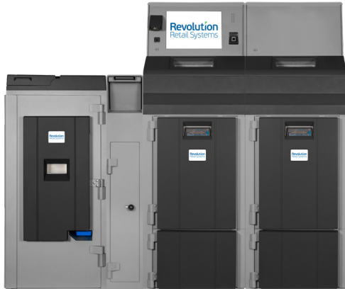
Fortis 4SE/5SE Dual with Drop Vault