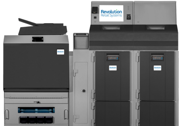
Fortis 43LW/5LW Dual with Drop Vault