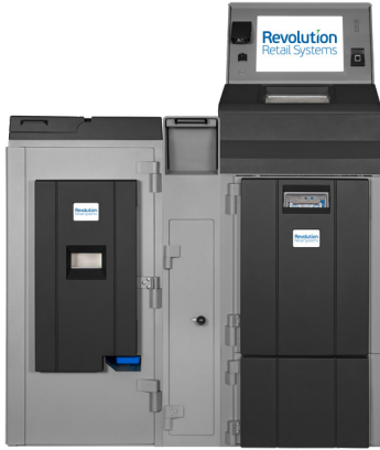
Fortis 4SE/5SE Coffre de Dépôt