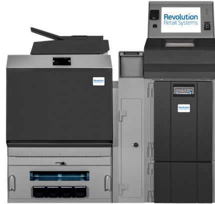
Fortis 4LW/5LW Coffre de Dépôt