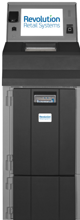
Fortis 4/5 Billets